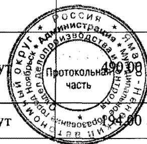
Таблица № 3